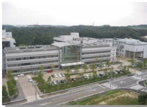
図：名古屋市北区の旧庁舎（左） 名古屋市守山区の志段味サイエンスパークにある新中部センター（右）